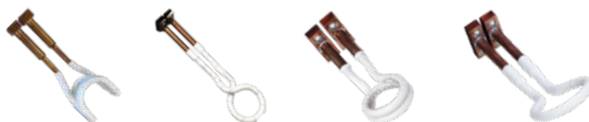
Cívka profilová "U"

Cívky pro DHI-100/120C Možnost zakázkové výroby cívek